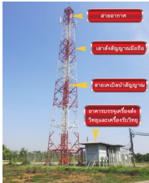
ภาพประกอบ 1) สถานีฐานของระบบโทรศัพท์มือถือแบบโครงสร้างเหล็ก

สถานีฐาน (Base Station) ของระบบโทรศัพท์มือถือที่ทำหน้าที่ส่งผ่านสัญญาณนั้น จะประกอบไปด้วย อุปกรณ์รับ-ส่งสัญญาณ สายอากาศ สายเคเบิลนำสัญญาณ และตัวโครงสร้างเสาสัญญาณที่ใช้รองรับการติดตั้ง อุปกรณ์ดังกล่าวมา โดยตัวโครงสร้างเสาสัญญาณจะมีลักษณะเป็นแบบ หอคอย โครงสร้างคอนกรีต และ โครงสร้างเหล็ก ซึ่งมีชื่อเรียกกันทั่วไปว่าเสาสัญญาณโทรศัพท์มือถือ ดังภาพประกอบ 1)