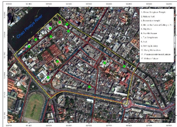
ภาพที่ 1 แสดงที่ตั้งอาคารโบราณสถานในพื้นที่ศึกษา 12 แห่ง